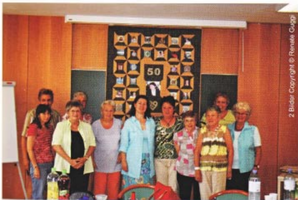
2 Bilder